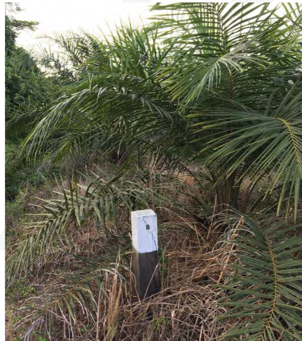
Gambar 5. Patok Batas Kawasan Hutan di Desa Tepian Buah