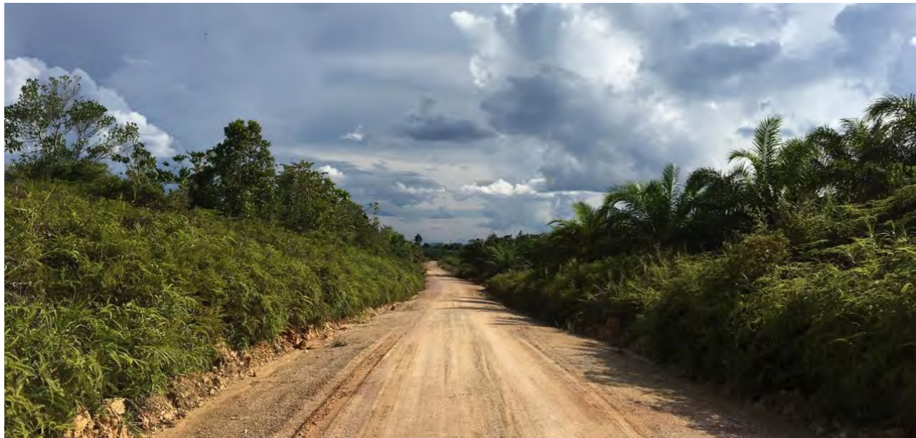
Gambar 3. Lahan Garapan Termasuk Sawit Rakyat dalam Kawasan Hutan di Sepanjang Jalan Logging.

Selaku pemegang konsesi atas kawasan Hutan Produksi di Desa Tepian Buah, PT Inhutani I bertanggungjawab untuk menjaga keutuhan kawasan hutan tersebut. Selama ini PT Inhutani I lebih banyak mengambil langkah persuasif seperti peletakan plang larangan (Lihat Gambar 4) dan dialog. PT Inhutani I tidak memilih langkah-langkah represif seperti pengusiran untuk menghindari konflik sosial dengan masyarakat. Menurut PT Inhutani I, batas antara kawasan hutan dan APL sudah tersedia secara jelas berupa patok-patok (Lihat Gambar 5). Namun, menurut masyarakat desa patok-patok itu belum jelas membedakan kawasan hutan dan APL sehingga mereka cenderung memilih untuk melanggar, apalagi ketika kawasan hutan hanya berupa semak-semak.