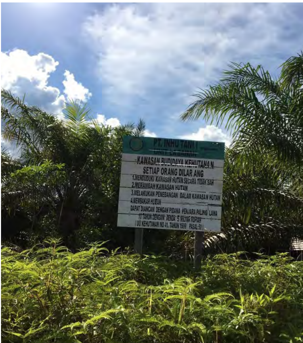
Gambar 4. Plang Larangan Merambah Kawasan Hutan oleh PT INHUTANI I.

Menurut Kesatuan Pengelolaan Hutan (KPH) Berau Barat yang bertugas dalam pengawasan dan pembinaan pemegang konsesi kawasan Hutan Produksi, sulitnya PT Inhutani I dalam menjaga wilayahnya disebabkan oleh keterbatasan dana dan sumber daya manusia.